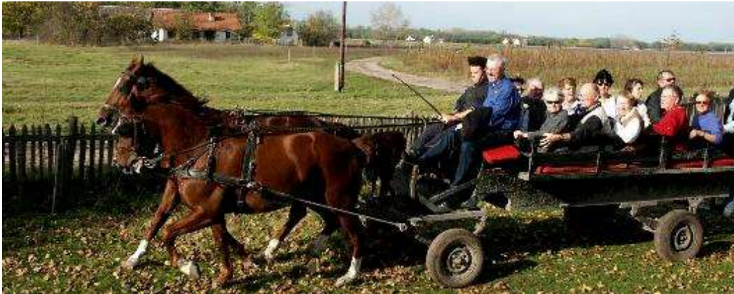
Mit dem Pferdewagen durch die Puszta