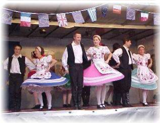
Eine abwechslungsreiche Show mit mehreren Kostümwechseln und fliegenden Röcken fesselte das Publikum.

Europa-Union Deutschland Stadtverband Haan e.V.