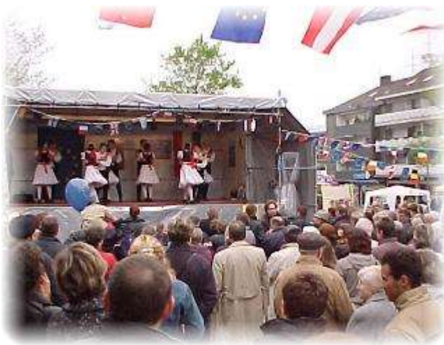
Am Nachmittag zog die ungarische Tanzgruppe Vadrózsa zahlreiche Zuschauer an.