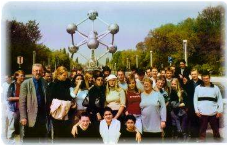
45 Haaner Realschüler vor dem Atomium

Neben einer Stadtrundfahrt standen auch Informationen über neueste Entwicklungen der Europäischen Union auf dem Informationsprogramm. Einen Rundblick auf Brüssel gab es aus der obersten Kugel des Atomiums. Mit dem Aufzug ging es auf 102 Meter Höhe und durch die Verbindungsröhren über Rolltreppen wieder auf den festen Boden.