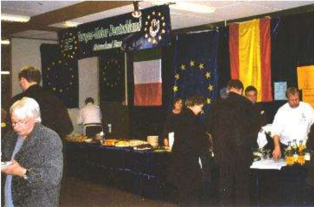
Info-Stand der Europa- Union Haan

Mit Musik und Tanz sowie Speisen und Getränken aus vielen Ländern wurde im Schulzentrum Walder Straße erstmals der "Tag der Toleranz" begangen. An einem Baum im Foyer der Schule konnte jeder Besucher seine persönlichen Gedanken zum Thema Toleranz zu Papier bringen und an einem der vielen Zweige befestigen. Ein weiterer Baum, eine libanesische Zeder, war aus der französischen Partnerstadt Eu mitgebracht worden und wurde nun auf dem Schulgelände eingepflanzt.