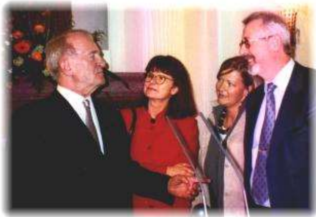
Vorstandsmitglieder der Europa-Union Haan von Bundespräsident Rau empfangen