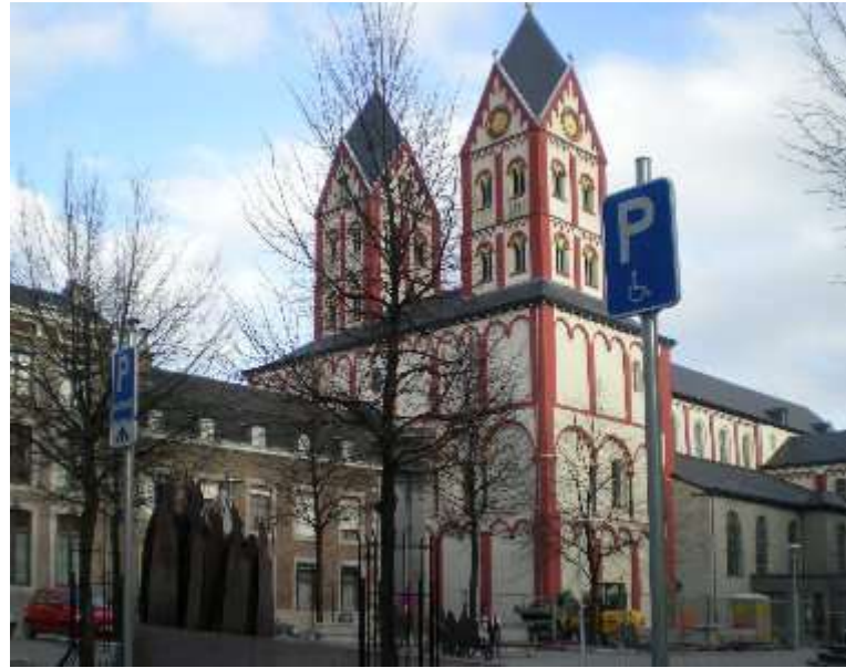
ehemalige Stiftskirche Saint Barthélemy

Bei sehr kaltem Wetter reichten heiße Gedanken nicht aus, eine angemessene Körpertemperatur zu erhalten. Umso schöner war es, als nach der Stadtführung genügend Zeit zur Verfügung stand, um in einem der vielen Restaurants zu essen oder direkt das einzigartige Weihnachtsdorf von Lüttich, dort „Village de Noël“ genannt, zu besuchen.