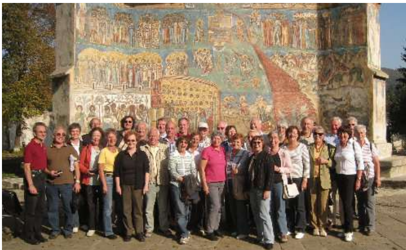
Die Reisegruppe der Europa-Union Haan vor der berühmten Westfassade der St. Georgskirche ("Sixtinische Kapelle des Ostens") im ehemaligen Kloster Voronet

Die Klöster der Bukowina, zwischen 1488 und 1585 vom aufstrebenden Moldaufürstentum erbaut, gehören zu den verblüffendsten Schätzen rumänischer Kunst, doch die farbenprächtig strahlenden an den Außenwänden machen sie in ihrer Art einmalig in der Welt. Das war auch der Eindruck bei der Besichtigung der Klöster Humor, Moldovita, Voronet und Sucevita.