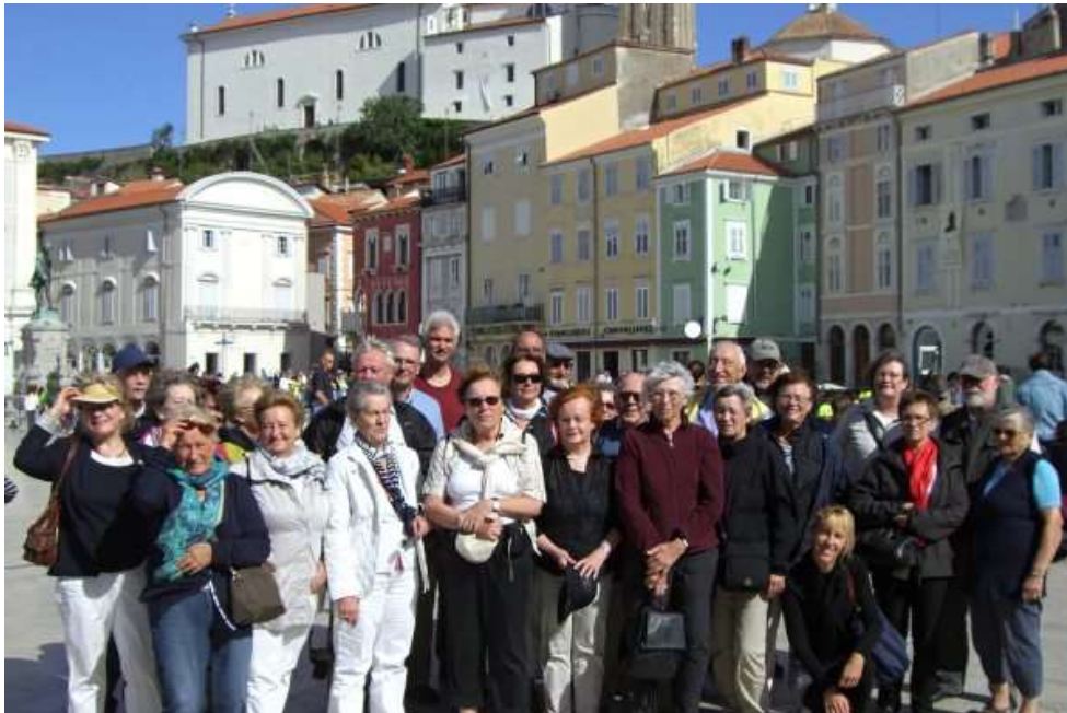
Reisegruppe in der Altstadt von Piran

Über Ljubljana ging es an die 47 Kilometer lange Adriaküste des Landes, wo italienisches Flair die Teilnehmer bei Sonnenwetter fast in Urlaubsstimmung versetzte.