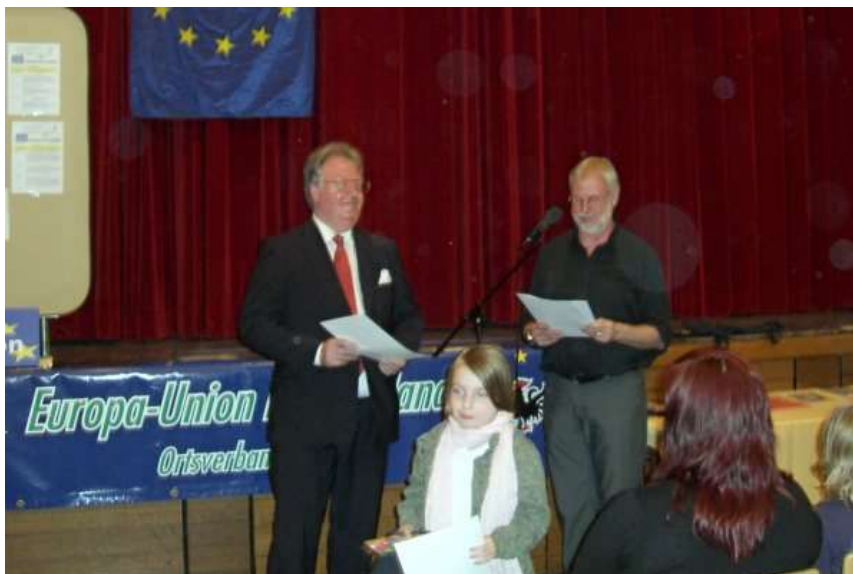
Europa-Union Deutschland Stadtverband Haan e.V.