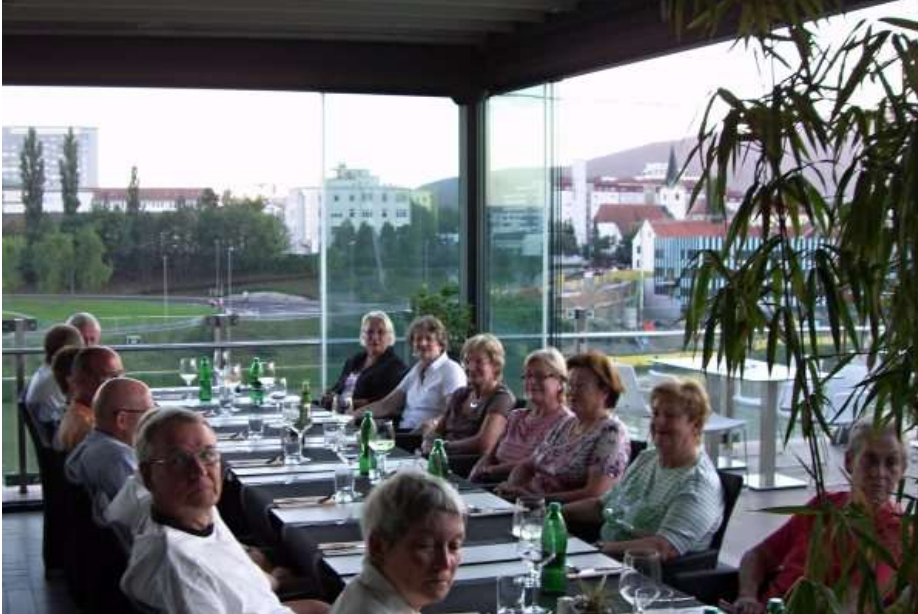
Abendessen mit Blick auf Maribor